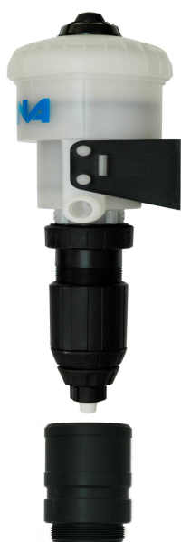
Abb. 1a Halter für die Wandbefestigung

Schließlich wird die Wasserzufuhr geöffnet. Gleichzeitig wird das Konzentrat angesaugt und vermischt sich im Mischgerät mit dem einfließenden Wasser zur gewünschten Lösung/Emulsion.